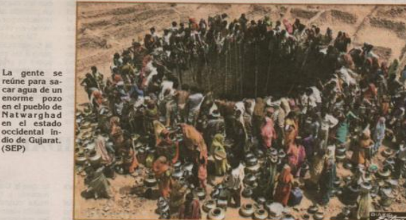
La gente se reúne para sacar agua de un enorme pozo en el pueblo de Natwarghad en el estado occidental indio de Gujarat. (SEP)