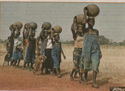
Según el Fondo de Población de Naciones Unidas, dentro de 25 años una de cada tres personas en la Tierra tendrá poca agua o nada. (SEP)