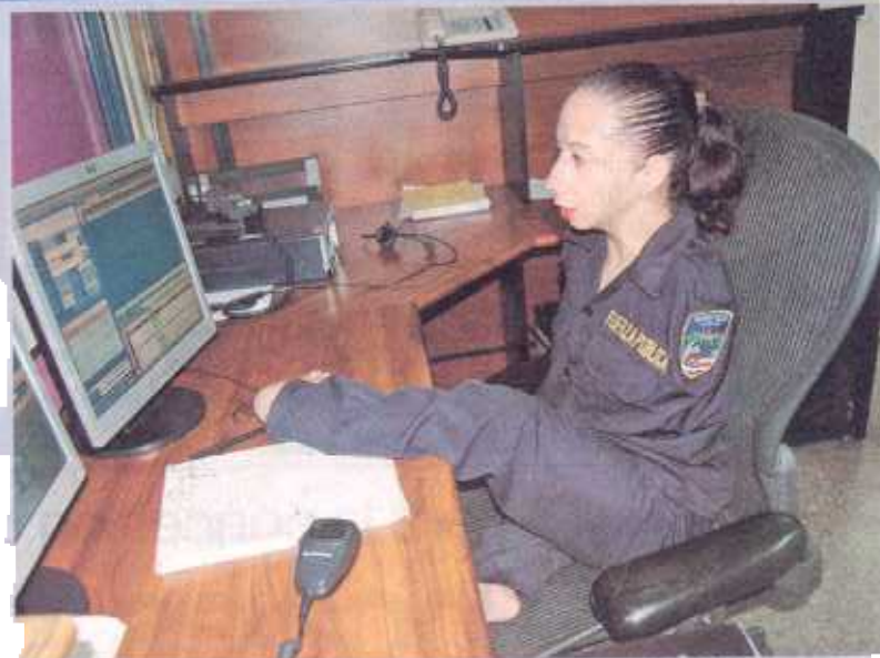
ella actualmente trabaja en control de comunicaciones del MED