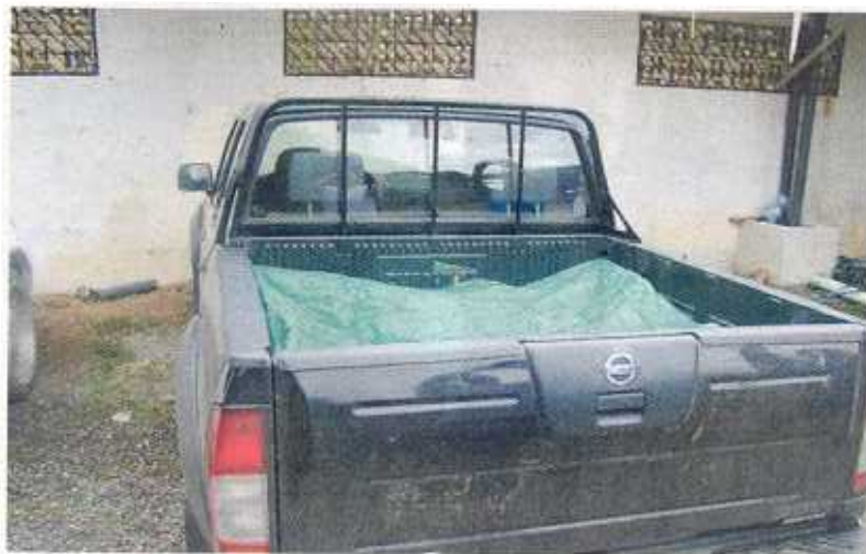
El cuerpo fue llevado a la Medicatura Forense. ALFONSO QUESADA GN

Entonces los parientes se devolvieron a sus casas, pero a eso de las 8 de la noche les avisaron que Paquita no había llegado así que se