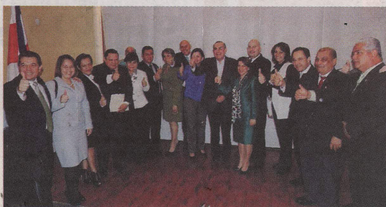
Diputados de Liberación le habían dado el apoyo a Arias.

El 29 de julio, La Nación volvió a publicar otra encuesta de Unimer y en esa ocasión, Arias quedaba en segundo lugar con el 22% del apoyo de los posibles elec-