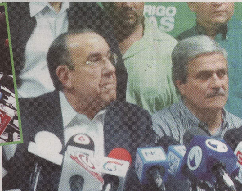
Rodrigo Arias hizo conferencia de prensa para anunciar su retiro. FOTOLA