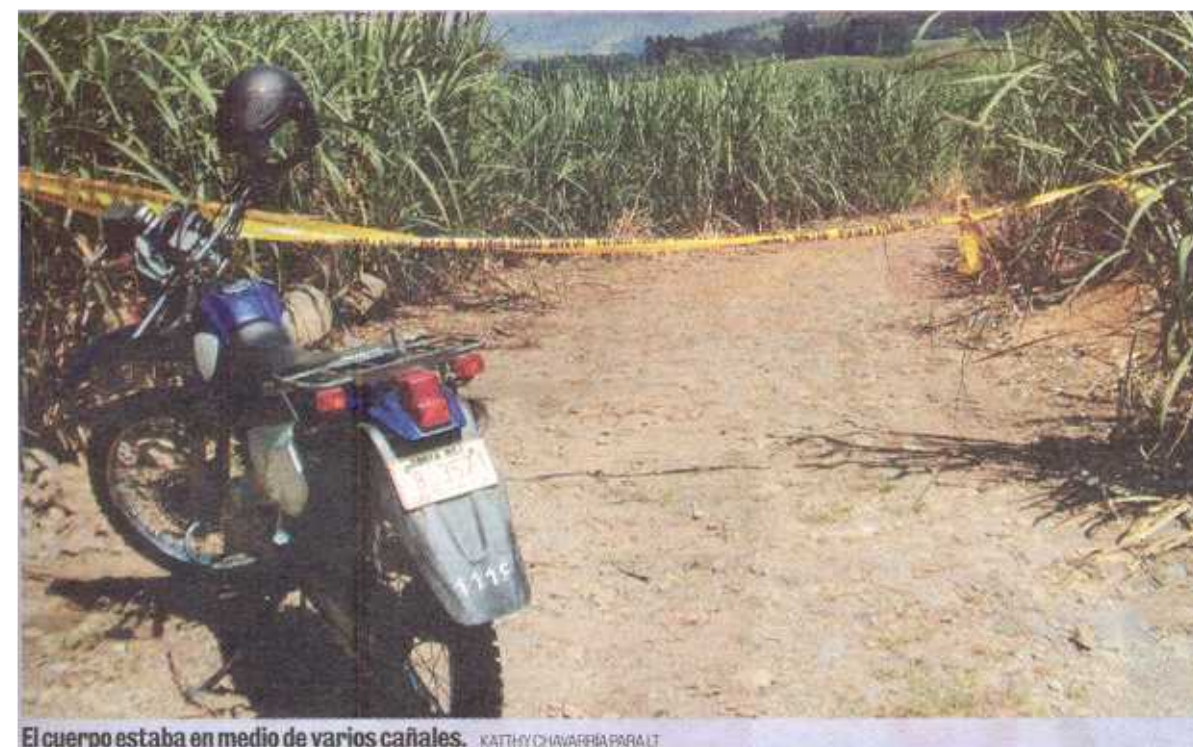
El cuerpo estaba en medio de varios cañales.

“Ella siempre viajaba al centro de Turrialba todos los jueves para ir a unos cursos”.