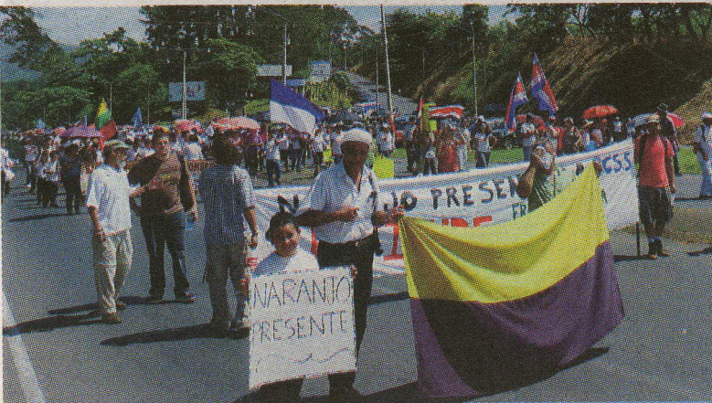
La marcha fue pacífica, pero sí provocaron presiones.