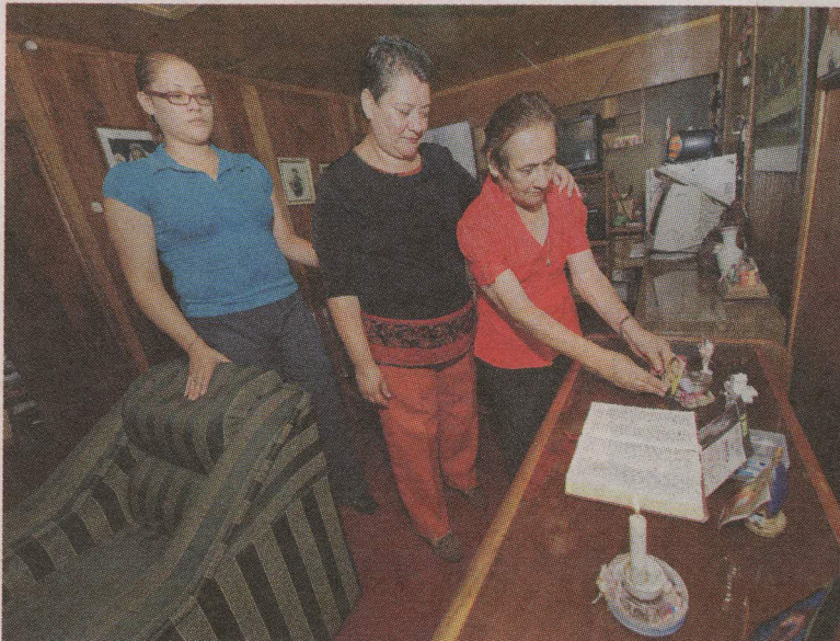
La familia de Valeria no deja de rezar para que aparezca. REBECA ARIAS

Los amigos y familiares de "Vale" han pegado fotos en postes de