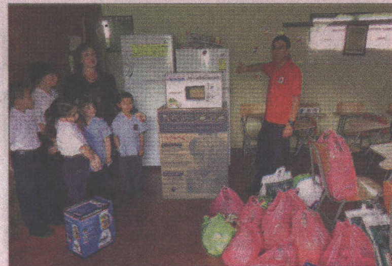
Refrigeradoras, microondas, licuadoras y mucho alimento son parte de todo lo que donó la Cruz Roja de Cartago a esta escuela.

Los miembros de la Cruz Roja, con su donación, han tratado de paliar en algo la problemática que se vive en esta escuela y, además, premiar el esfuerzo de docentes y administrativos, así como de los niñas y niñas estudiantes, que se presentan cada día a cumplir cada uno con su tarea, a pesar de las adversidades.