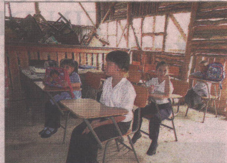
Para poder impartir y recibir lecciones, se debió improvisar un galerón.