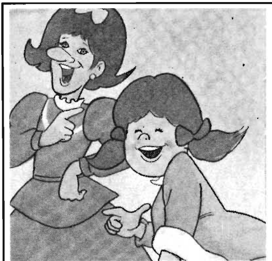
SE MOFABAN DE ELLA CONTINUAMENTE Y ABUSABAN DE SU BONDAD Y TERNURA.

protagonista femenina, que generalmente es una niña o muchacha joven. Sus principales características serán su belleza, su simpatía, su bondad, su ingenuidad, su debilidad, y en todos los casos requerirán de un hombre, sea un príncipe, un leñador, o un conejito o gatito macho, quién aparece en el cuento para protegerlas de una mala mujer, o de un animal feroz.