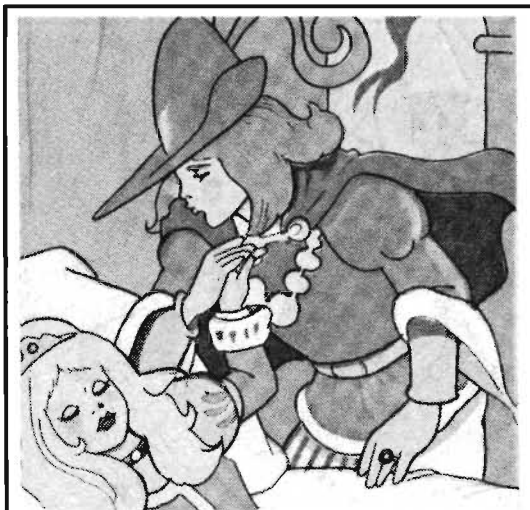
TOMANDO SU DELICADA MANO, EL PRINCIPE LA BESO CON TERNURA.