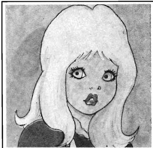
EL PADRE DE CENICIENTA HABIA SALIDO A UN LARGO VIAJE Y LA NIÑA ESTABA INDEFENSA.