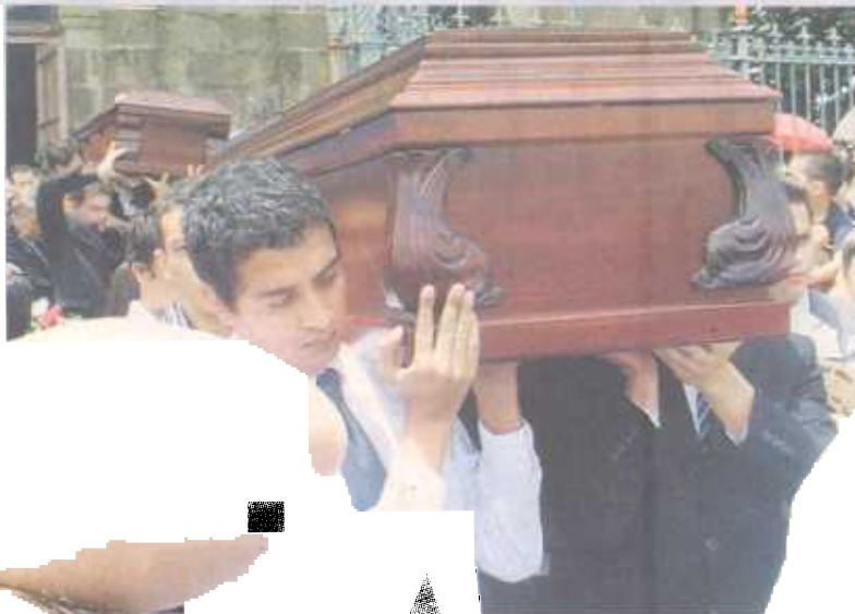
Unas mil personas llegaron a la iglesia. ROBERTO ACOSTALT