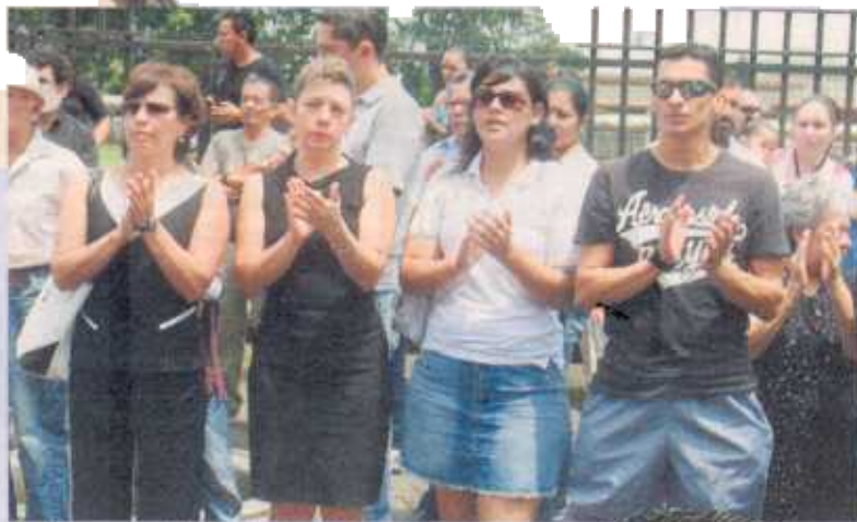
Vecinos aplaudieron al final de la misa. ROBERTO ACOSTALT