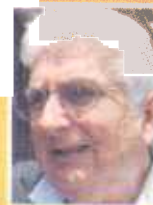
FERNANDO BERROCAL EXMINISTRO

"Estamos a tiempo de poder detener esto. Es lamentable la forma en que mataron a estas mujeres".