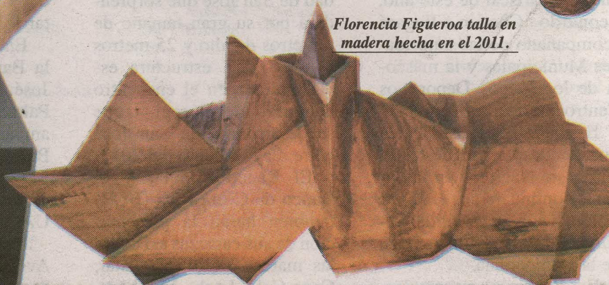
Florencia Figueroa talla en madera hecha en el 2011.