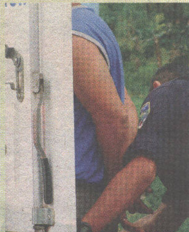
El agresor fue detenido de inmediato.