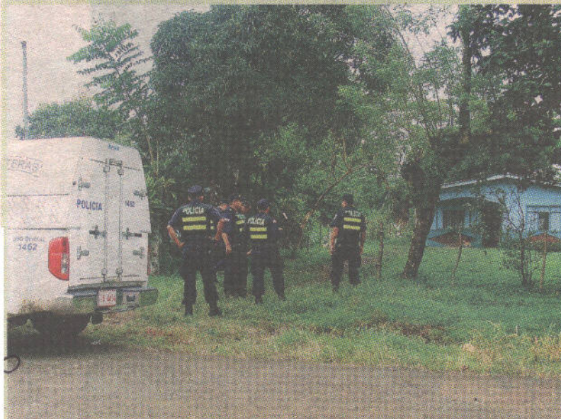
La Policía llegó a salvar a la mujer.