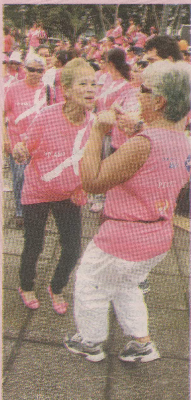
En la Plaza de la Democracia se armó la pachanga.