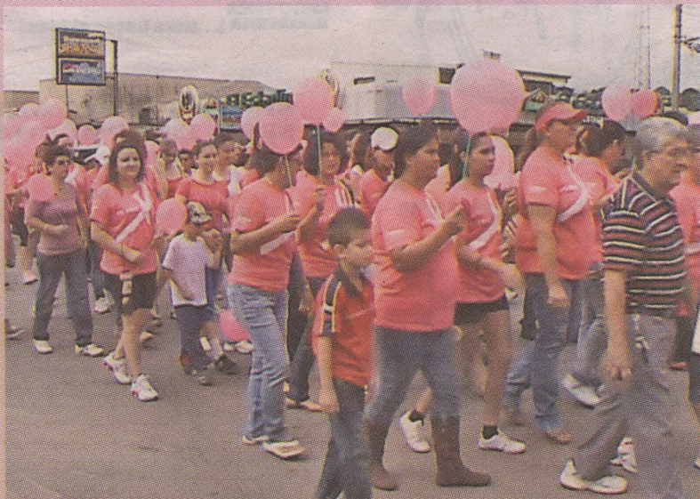
La gente respondió y participó en gran cantidad.