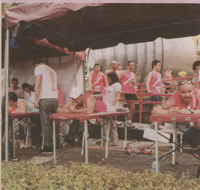
Al final los atletas recibieron un cariñito.