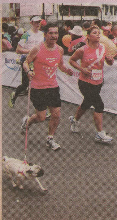
Él se llevó al mejor amigo del hombre: su perrito.