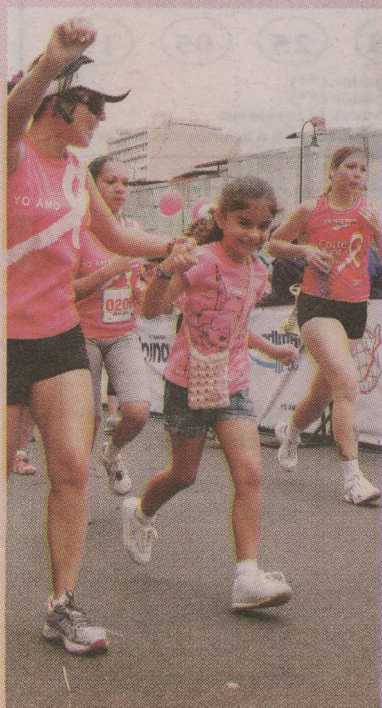
Hasta las chiquitas quisieron participar.