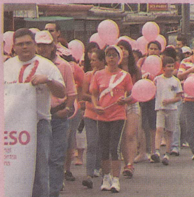
San Isidro fue el único lugar fuera de la capital donde se realizó la caminata.