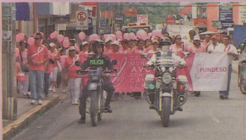
El Tránsito puso orden pero les faltó la "chema".

La caminata salió a las 9 a.m. de la escuela de Enseñanza Especial.