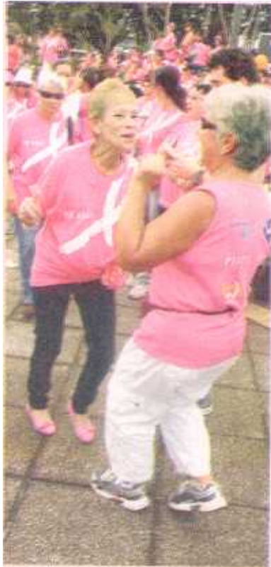
En la Plaza de la Democracia se armó la pachanga. SSANDI

carrera (10 kilómetros) y caminata (3 kilómetros) que partió a las 8 a.m. con unas 2.000 personas participantes, según los organizadores.