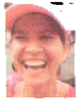
FABIOLES AMA DE CASA

“Formidable, muy bonita y bien organizada. La asistencia estuvo bien y claro que la volvería a hacer”.