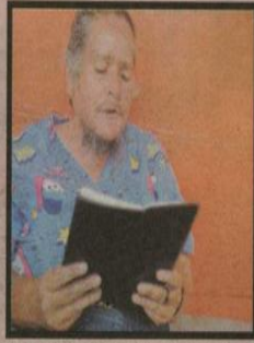
La libreta está escrita a mano y con una letra muy bonita. GRACELASOUSLT

Vera luce orgullosa su barba, que le ha crecido por los medicamentos. "La mujer de barba es más brava", dice siempre. GRACELASOUSLT