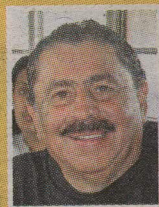
GERARDO RAMÍREZ CANTANTE