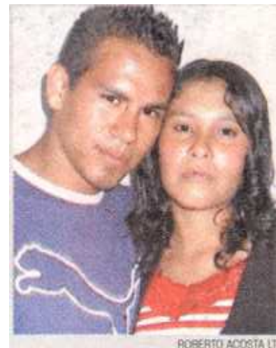
El amor terminó con muerte.