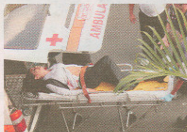
La cajera del BCR recibió un balazo en el estómago.

"No se lo deseo a nadie. Fue algo muy duro. Lo hago (presentar la demanda) para que nadie más pueda vivir lo que yo viví. Gracias a Dios