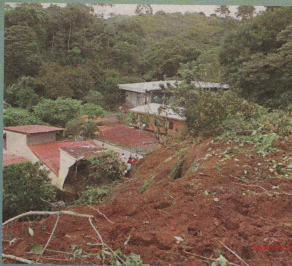
Cuatro casas resultaron afectadas por un derrumbe en Botecito de Turrialba.