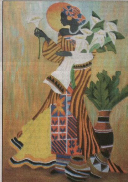
La precisión y la paciencia permiten crear verdaderas obras cuyo valor asciende incluso a los 2 mil dólares.