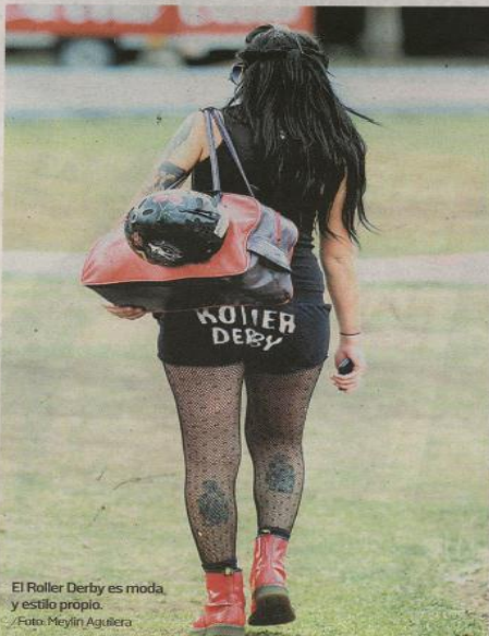
El Roller Derby es moda, y estilo propio.

Sus atuendos multicolores son de acuerdo a su personalidad y carácter. Patines de cuatro ruedas a la antigua, cascos, protectores, tatuajes y una gran dosis de adrenalina y fortaleza a la hora de medirse a la oponente. En Costa Rica un grupo de chicas dominan el arte del Roller Derby, deporte estadounidense donde dos equipos, en este caso de jóvenes, se miden para saber quienes son las mejores y más rudas del patinódromo. Golpes, caídas y moretones son parte de esta disciplina, en la cual se busca puntuar más que el rival. Al final es solo un juego, cada quien mantienen su estilo, belleza y elegancia hasta la próxima vez que midan en la pista.