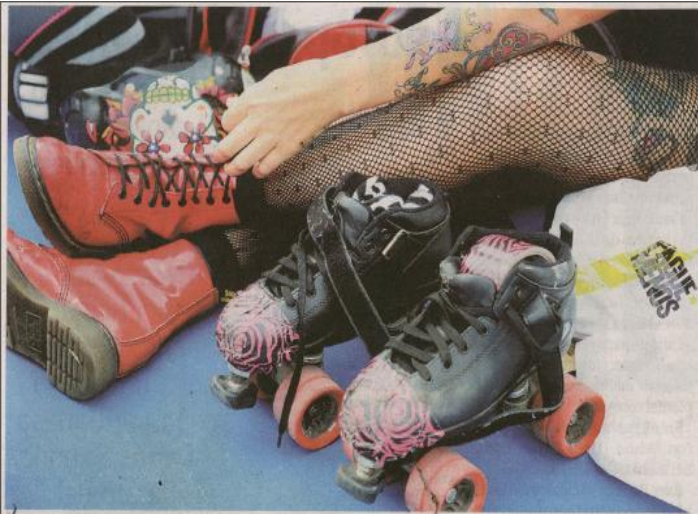
La personalidad de cada jugadora se plasma en su atuendo y accesorios.