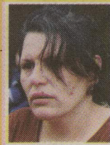
EETEGIVE ROMERO MAMÁ