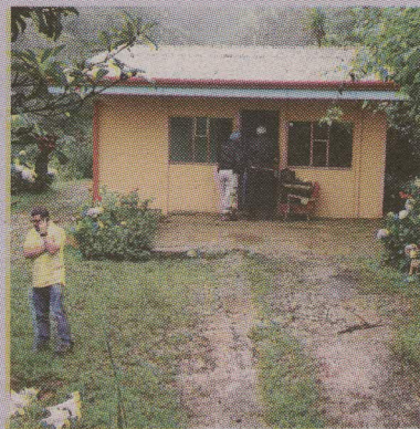
El cuerpo estaba dentro de esta casa abandonada. RONALD REYES GN

Ni el pelo se le ve. Hasta ayer en la tarde la familia de Dayanna no sabía nada del paradero del amigo que la acompañaba cuando regre-