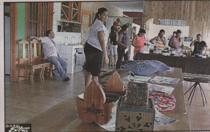
Mujeres de Sierpe, Osa, encontraron en los bosques la materia prima para fabricar mesas, espejos y lámparas.