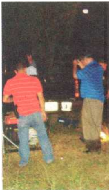
El cadáver estaba a la orilla del río San Pedro. MARIO CORDERO GN

Leiva agregó que conocía a la muchacha pues el año pasado le