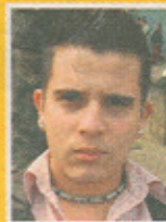
RODOLFO ACUÑA FOTÓGRAFO

"Que esté con vida es porque Dios tiene algún propósito para ella. Le aconsejo que no se acerque más al agresor".