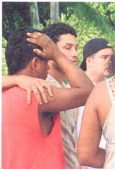
El ataque dejó a más de uno sin respiración.

“A Muñoz le molestó mucho que ella lo fuera a denunciar ante un juez de familia”, comentó Ma-