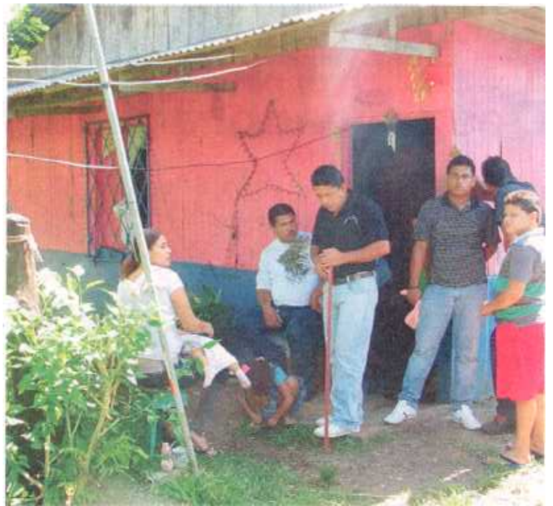
Familiares de mamá e hija prefirieron no hablar ayer. FREDDY PARRALES PARA LT

“Me dijo que me cuidara mucho, que no peleara con mi esposo.