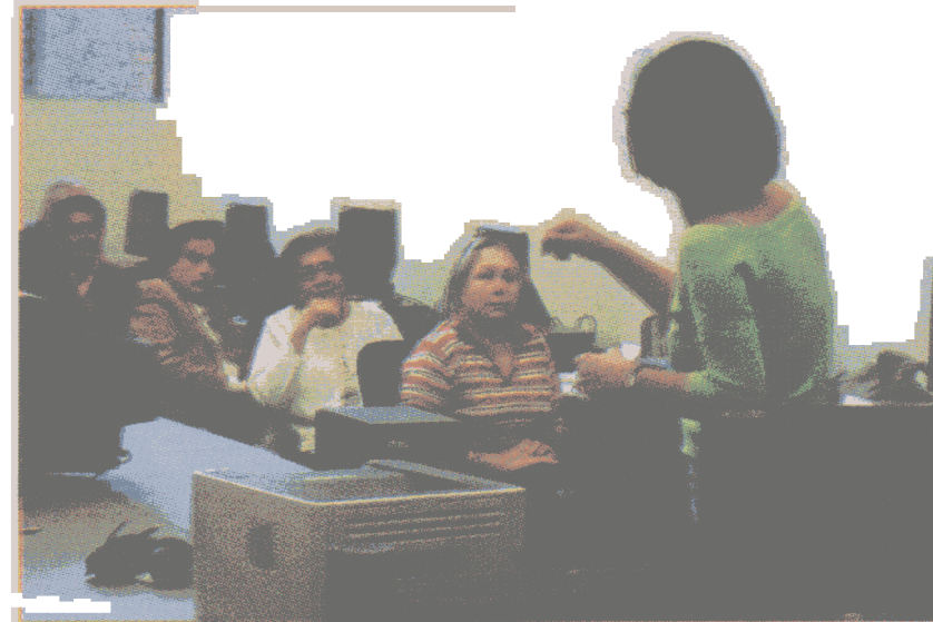
Más de 15 adultos mayores decidieron participar del mundo de la tecnología.

Los cursos duran aproximadamente una semana y en quince días salen con los conocimientos básicos de informática que les permitirá ingresar a nuevos cursos en próximos meses.