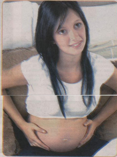
Muchas veces son los mismos padres de familia quienes les impiden a las jóvenes capacitarse en el tema de las relaciones sexuales.

Recordó que en el Hospital Calderón Guardia se atienden alrededor de 6.500 partos por