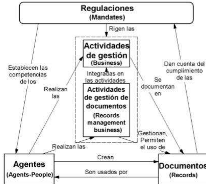
Figura 1 Modelo conceptual de entidades: principales entidades y sus relaciones

Fuente: Norma ISO 23081-2:2011 Información y documentación. Procesos de gestión de documentos. Metadatos para la gestión de documentos. Parte 2: Elementos de implementación y conceptuales.