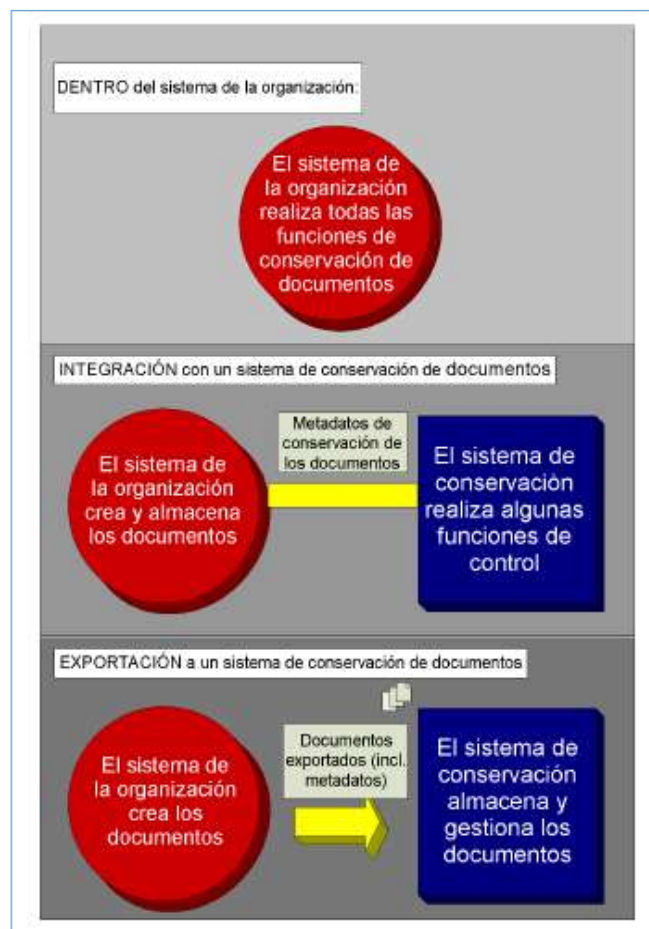
Figura 4 Posibles opciones del sistema para gestionar los documentos creados en un sistema de la organización

Fuente: Norma ISO 16175-3. Principios y requisitos funcionales para documentos en entornos de oficina electrónica. Parte 3: Directrices y requisitos funcionales para documentos de la organización.