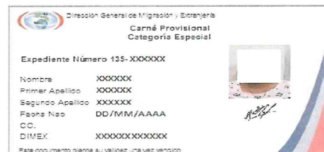
IMAGEN DEL REVERSO DEL DOCUMENTO