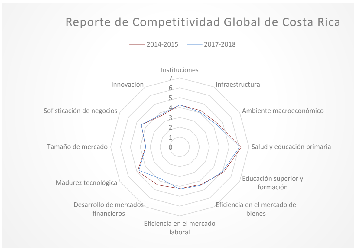
Figura 1. Costa Rica. GCI 2014-2015 / 2017-2018 Fuente: Foro Económico Mundial, 2018

Otro aspecto para considerar es la medición que se realiza a nivel global relacionada con la facilidad que tienen los ciudadanos en general para hacer negocios en el país (Doing Business). Este año Costa Rica se encuentra en el puesto 61 de una muestra de 190 países, en lo que respecta a la región de Latinoamérica y el Caribe ostentamos el cuarto lugar detrás de México, Perú y Colombia. El país mantiene deficiencias en las áreas de resolución de insolvencia, protección de inversionistas minoritarios, apertura de un negocio, entre otras áreas de interés. Particularmente se mejoró en el componente de acceso al crédito, sin embargo, más adelante se puede ver que este componente no se traduce en mejores condiciones para aquellos que desean emprender un negocio desde cero.