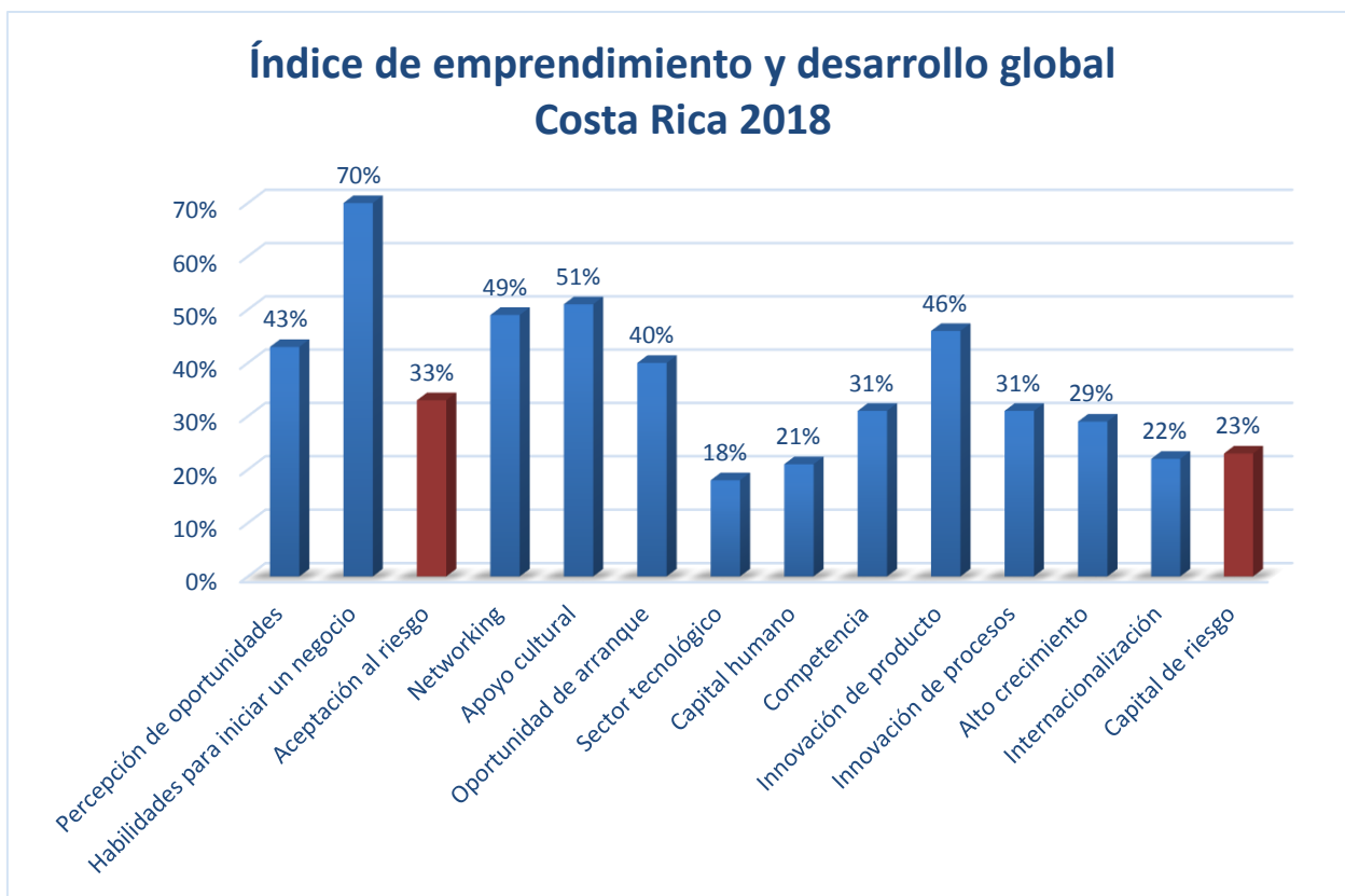
Figura 3. Costa Rica. GEDI 2018