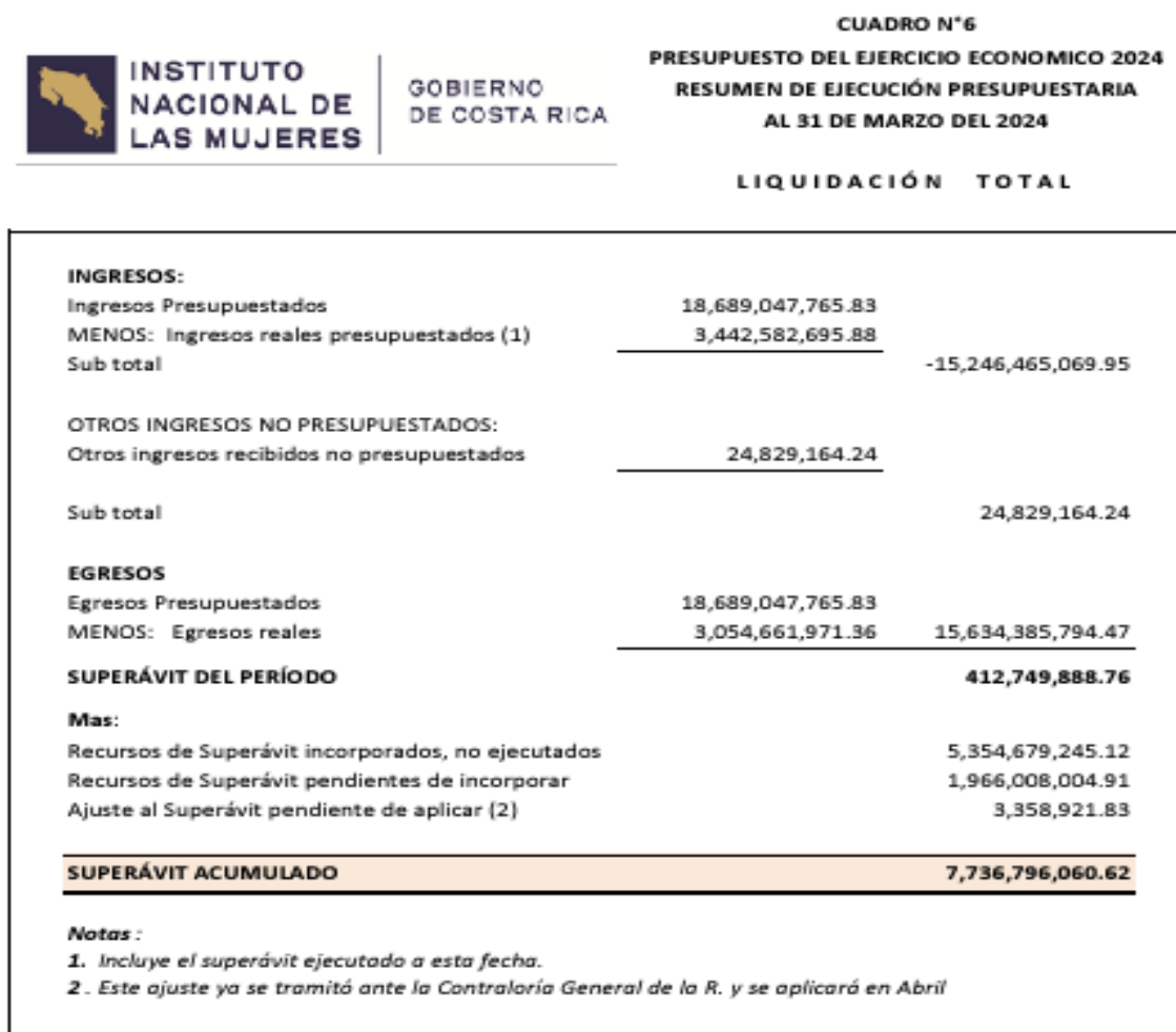
Figura 4. Informe de ejecución I trimestre del año 2024, Instituto Nacional de las Mujeres (Inamu)