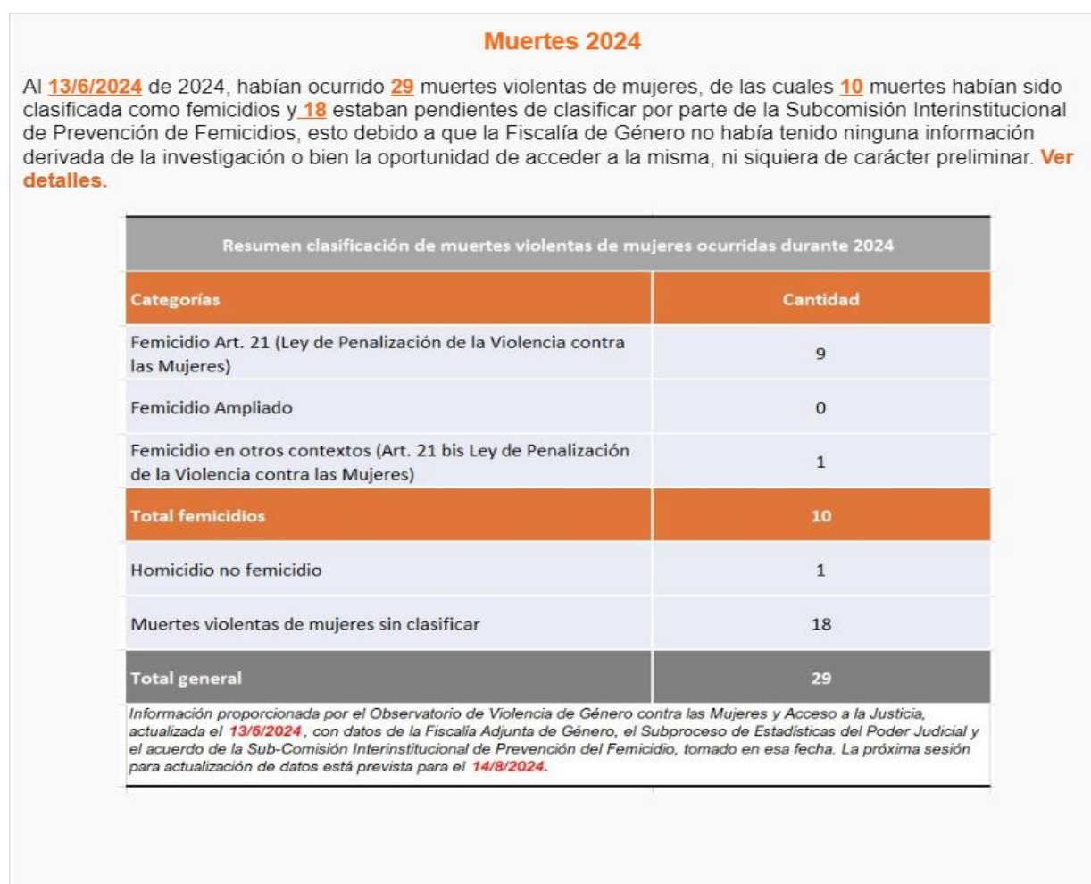
Figura 1. Femicidios 2024. Observatorio de Violencia de contra las Mujeres y Acceso a la Justicia

Esta página fue actualizada con datos al 13 de junio de 2024.