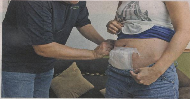
La mujer sufre terribles dolores por tener la herida abierta. JHNDURAN

"Me abrieron los puntos y la limpiaron, me dijeron que me la tenía que dejar abierta hasta que estuviera bien. Eso fue hace como 15 días y desde ahí ya no puedo ni alzar a mi chiquito de 4 años. Tuve que dejar mi casa e irme para donde mi mamá para que me atiendan a mí y a mis hijos" relató angustiada.