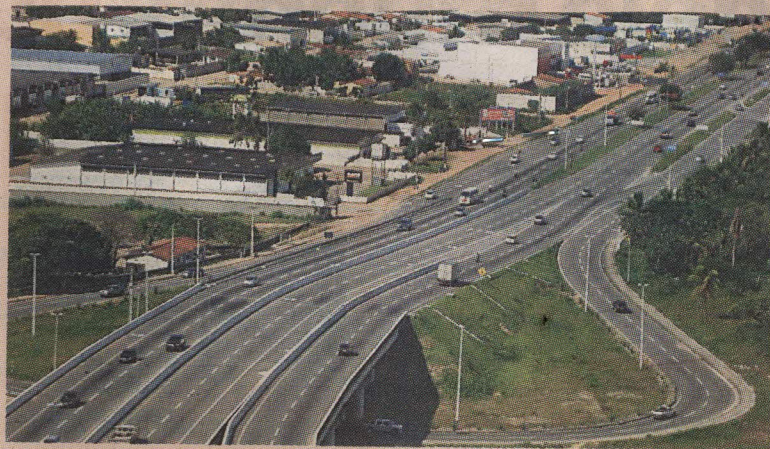
El tico estuvo detenido en el municipio de Parnamirim. NOTICIAS DORN

Ulate, quien es vecino de Tilarrán, Guanacaste y asambleísta del PAC, cayó el 18 de junio, en Natal, capital del estado de Río Grande del Norte, cuando denunció a un