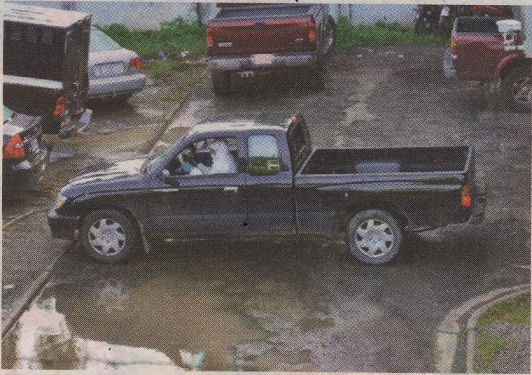
Judiciales decomisaron el carro en el que viajaba la pareja. RAÚL CASCANTE

Las autoridades investigan si la mujer estaba embarazada porque algunos vecinos lo afirmaron; sin embargo, hasta ayer a las 5 p. m. los