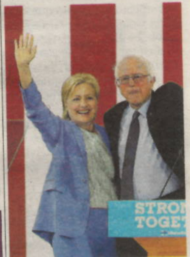
Clinton y Sanders en un acto este martes en Portsmouth.