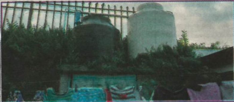
Los tanques de agua ponen en riesgo a los habitantes del albergue.

Consultados en el Ministerio de Salud sobre los permisos respectivos para la operación del albergue, confirmaron que todo se encuentra vigente y que se deben renovar el 23 de setiembre de 2020.