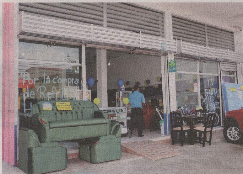
Los dueños de la tienda quedaron con la boca abierta. REINER MONTERO.

En un video difundido por el departamento de prensa del OIJ se ve a la mujer entrar a la tienda M Express aprovechando un momento en el que el guarda no estaba.