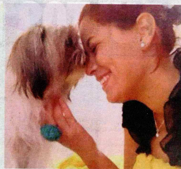
Siempre ha sido un joven amorosa que ahora quiere justicia.

“ Los doctores no se explican cómo quedó viva ni cómo está consciente”.