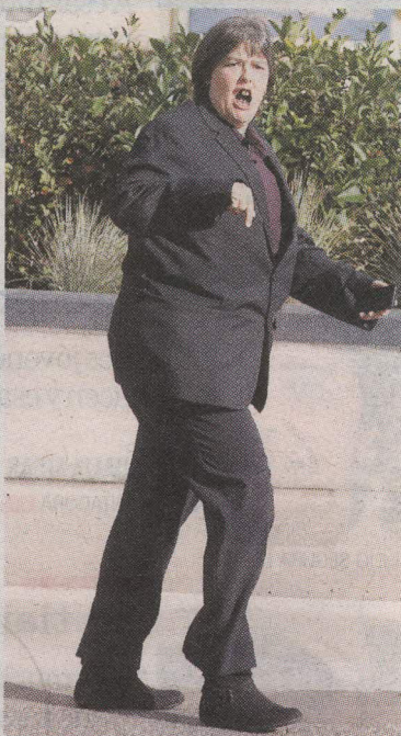
La mamá dijo que no pensaba que vivían en malas condiciones.