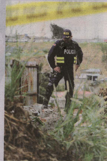
Barrio México fue uno de los primeros sitios de muerte. GESLINE

“Estamos manejando información con medicina legal para deter-