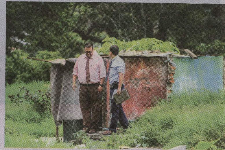
Un lote en Sagrada Familia fue el último escenario de estos asesinatos. La identidad de la víctima se desconoce. JOSÉ CORDERO

SOBREVIVIENTE PODRÍA DAR LA PISTA DE HOMICIDA EN SERIE QUE ATACA A MUJERES INDIGENTES