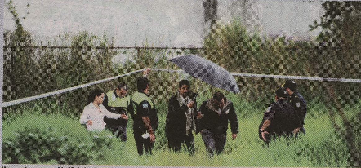
Una mujer apareció el 5 de junio en Sagrada Familia. El OIJ no la ha podido identificar. MARCELA BERTOZZI