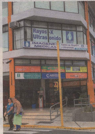
La agresión ocurrió frente al hospital Calderón Guardia. LA TEJA.

La golpeó. Las cámaras de seguridad de un centro comercial dejan ver que la mujer pasó frente a Ro-