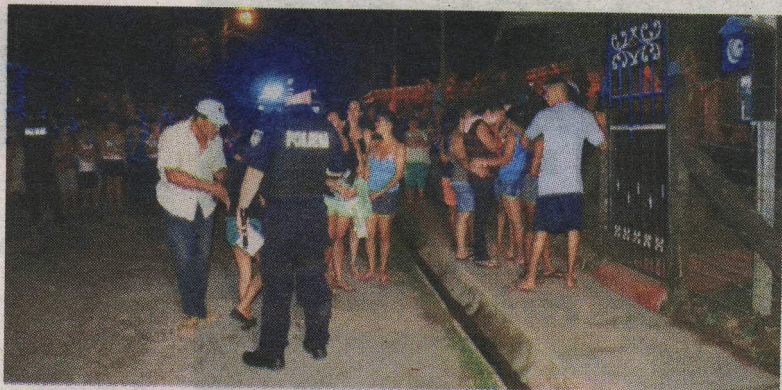
La Policía ayudó a calmar los ánimos de los vecinos. REINER MONTERO

ter el tiroteo, se dieron a la fuga en la moto. En el sitio del crimen los investigadores judiciales recolectaron varios indicios balísticos, los cuales fueron enviados a los laboratorios del Complejo de Ciencias Forenses del OIJ, para que sean