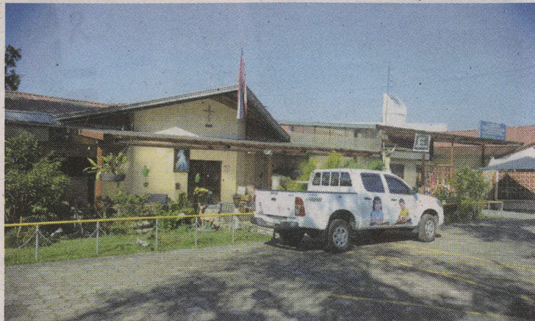
El OIJ allanó las oficinas del convento, en Ipís de Goicoechea, muy temprano.