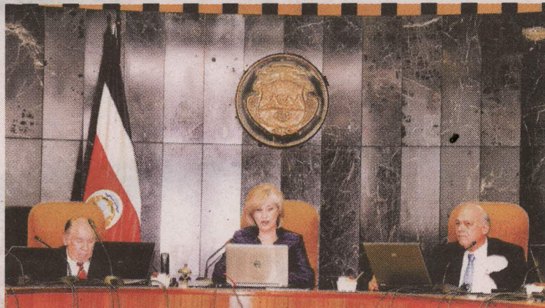
La Corte Plena escoge al nuevo director del OIJ.

la Corte ya había tenido la oportunidad de conocer a los aspirantes, ya que entrevistaron a las trece