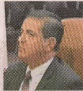
Rodrigo Vásquez (juez)