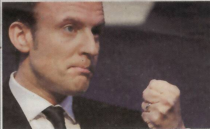
Emmanuel Macron expuso ayer en París su plan de gobierno.

PARÍS. AFP.- El candidato de centro a las elecciones presidenciales de Francia, Emmanuel Macron, completó ayer la presentación de su esperado programa, que denominó "un contrato con los franceses" y el cual contempla, entre otras propuestas, una reforma al sistema de pensiones, sin aumentar la edad de retiro.