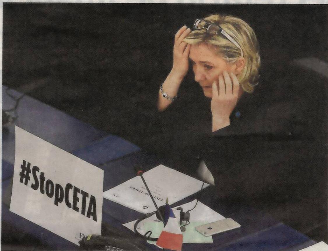
La candidata presidencial ultraderechista Marine Le Pen mientras participaba, en Estrasburgo, Francia, en la votación de un acuerdo de libre comercio entre la Unión Europea y Canadá.

A petición de la familia de James Foley, "muy impactada", la política francesa retiró la imagen de este periodista es-