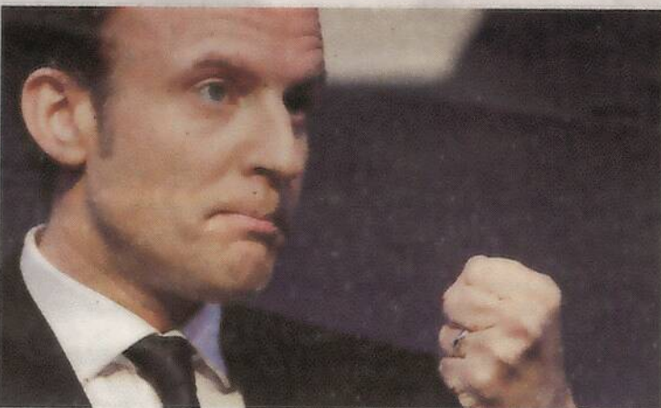
Emmanuel Macron expuso ayer en París su plan de gobierno.

PARÍS. AFP.- El candidato de centro a las elecciones presidenciales de Francia, Emmanuel