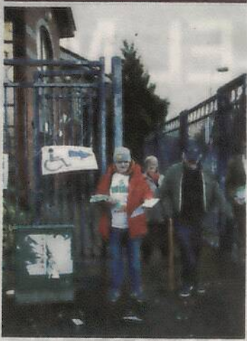
Ciudadanos salían ayer de un centro de votación en Belfast.