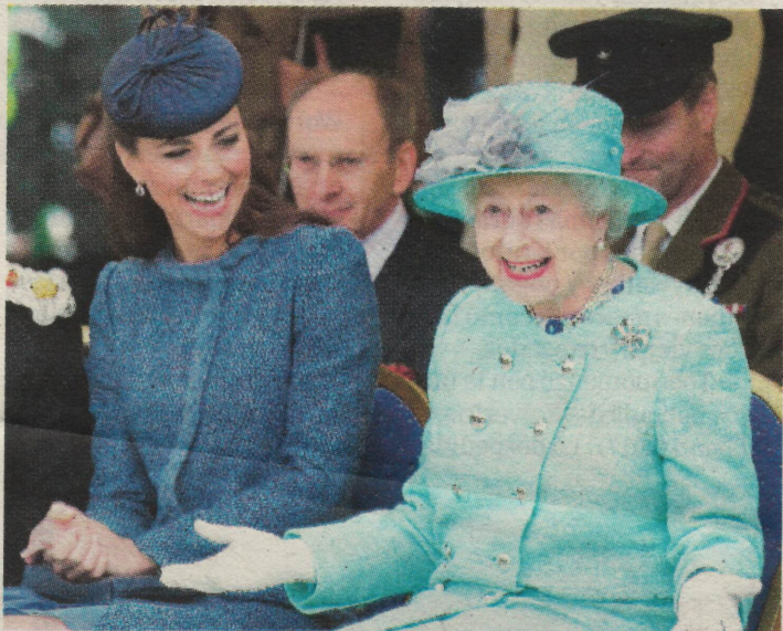
No siempre es una dama seria. Acompañada de la princesa Catalina, la reina Isabel II mostró su sonrisa en una actividad benéfica.

SE PRESUME QUE LA ÚLTIMA MORADA DE ISABEL II SERÁ LA CAPILLA DE SAN JORGE, UBICADA EN EL CASTILLO DE WINDSOR. ALLÍ DESCANSA SU MADRE, ISABEL BOWES-LYON, Y SU PADRE, EL REY JORGE VI.