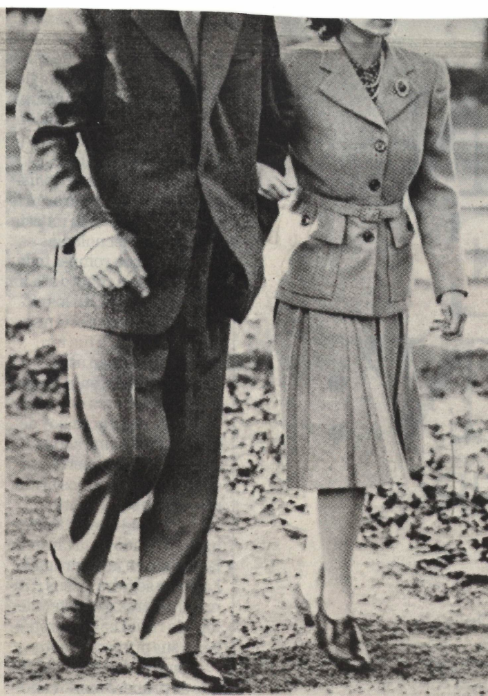
En una foto del recuerdo, Isabel II se pasea junto a Felipe, duque de Edimburgo. Él es su esposo, con quien se casó en 1947.

CORONADA REINA EL 2 DE JUNIO DE 1953. LA MONARCA NACIÓ EL 21 DE ABRIL DE 1926 Y ACTUALMENTE TIENE 92 AÑOS DE EDAD