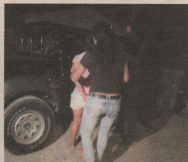
La mujer cayó el lunes y ayer analizaban ponerle medidas. ALFONSO QUESADA.

Cordero manifestó que aplicaron una medida de protección de abrigo temporal para hacerse cargo de los niños por seis meses, todo