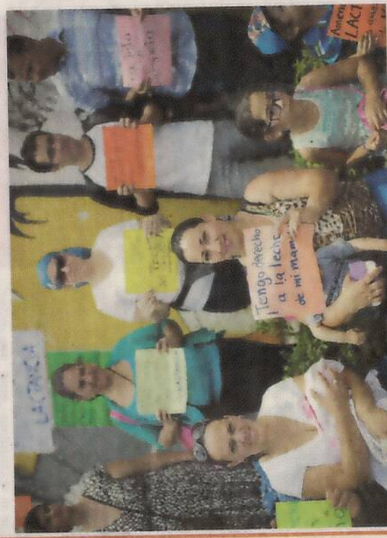
Tribu La Mamatón llegó ayer como con 40 mujeres a dar del pecho en el bulevar de la Asamblea Legislativa, a modo de protesta. JOSE CORDERO.