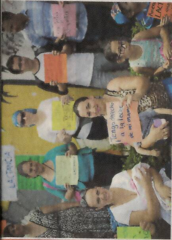
Tribu La Mamatón llegó ayer como con 40 mujeres a dar del pecho en el bulevar de la Asamblea Legislativa, a modo de protesta. JOSÉ CORDERO.