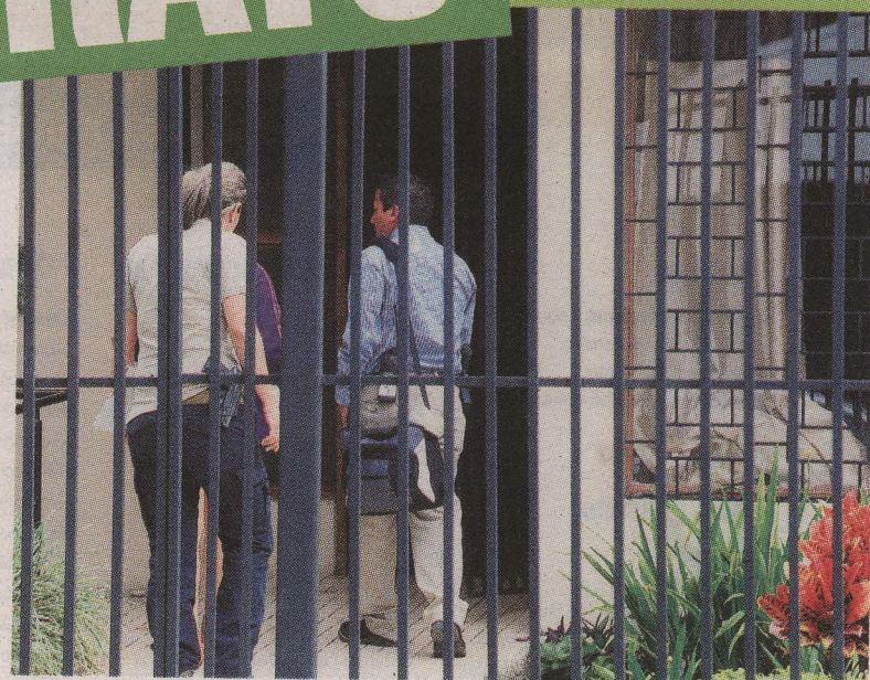
Agentes del OIJ revisaron ayer el lugar toda la mañana.

Con antecedentes. La vocera del OIJ además confirmó que el sospechoso presenta una denuncia en su contra por agredir con un cuchillo a la compañera sentimental.